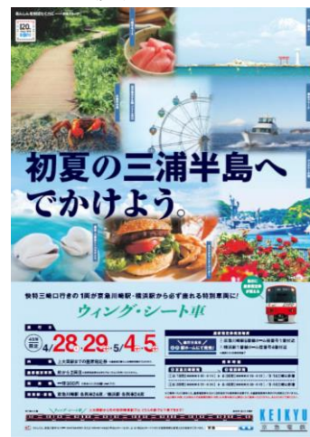
ポスターイメージ