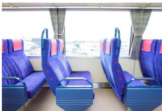
「ウイング・シート車」に使用する2100形とオールクロスシートの車内